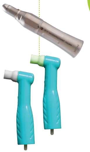
B.A. gerades Handstück

TIPP Bitte beachten Sie die Arbeitszeiten in der Anleitung