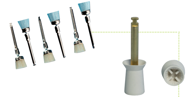
HS-Prophylaxe-Kelche & HS-Prophylaxe-Bürstchen & HS-Einmalprophylaxe-Kelche