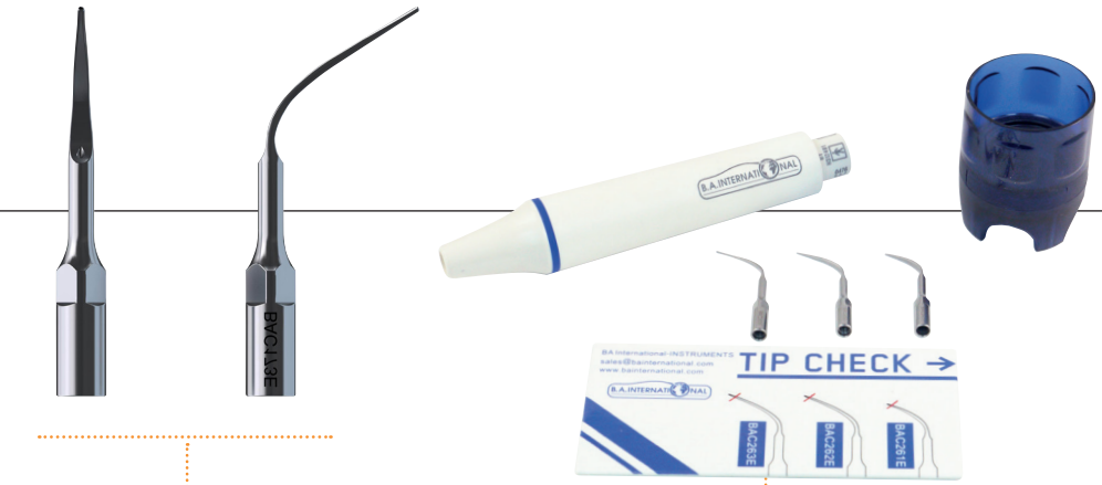
B.A. ZEG Spitzen