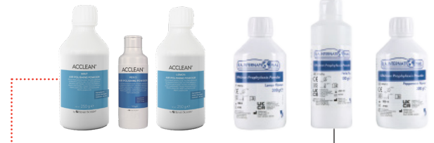
B.A. & HS-Acclean Prophylaxe-Pulver